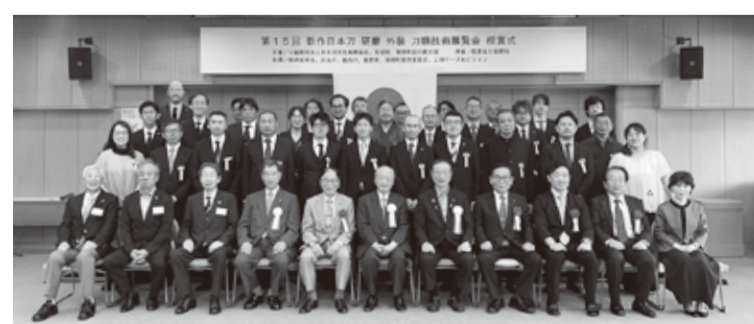
受賞者の皆さんと主催関係者