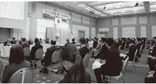
現代刀職展の表彰式会場

最後に閉会の辞をもって、今年度の表彰式は幕を下ろした。現代においても日本刀の文化が静かに、しかし確実に生き続けていることを感じさせる一日となった。