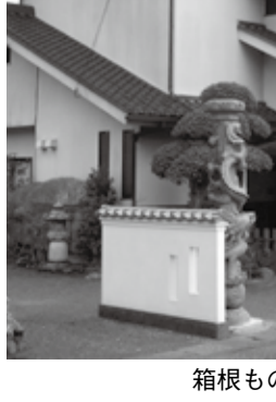
箱根もののふの里美術館

という湯けむり近くの場所で静かにその余生を送っている。この春には板橋区立郷土資料館の当世具足展に友情出張し、現在の猪山家の人々とも再会を果たした。金沢への里帰り展も構想に入った。