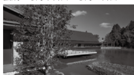
せんぐう館と奉納舞台

開館特別企画展のメインテーマである「重浪帰する国」とは、天照大神がご託宣で伊勢の地を「常世(海の彼方にある理想郷)の波がしきりに打ち寄せる国である」と称したことになむ。本展では、神宮の営みと海とのかかわりについて、わが国の姿と豊かな恵みをとらえている。