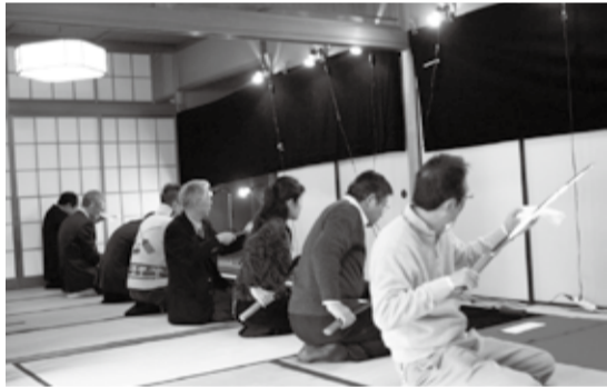
・短刀 国吉 附天和二年光常折紙