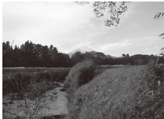
草分さんの秘密の釣り場はココ

刀剣業界の情報紙である『刀剣界』では、記事を募集しています。ニュースや催事情報、イベント・レポート、ブック・レビュー、随筆・意見・感想など、何でも結構です。写真も添えてください。組合員・賛助会員以外の方も歓迎です。ただし、採否は編集委員会に諮り、紙面の関係で編集させていただきます。