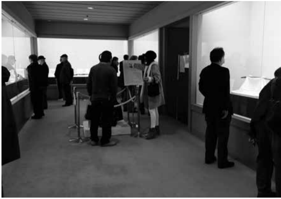
『真田丸』と『おんな城主直虎』の時代の刀展 出品目録