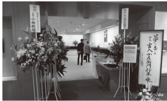
「夢は香る」会場入り口

先生のなどと茶化すので俺は彼を「教授」と呼ぶ。何だかお勉強がでなくて単位が怪しくなってきた学生が態度を急に変えるみたい。あっ、何と昼の営業はしていない。勝手にカルピんやブルコギ定食を想像していた俺は、少しがっかりしてペダルを回す。そんな俺を国道で「石抜きまっす」と追い抜いた学生二人組は、強豪ではないが、お勉強もできる大学の自転車競技部のジャージ。上野の杉江雄治組合員の母校でもある。