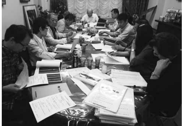
熱がこもる出張校正の作業風景

このようにして、刀装・刀装具の撮影が延べ六日間、刀身の撮影は一月にわたり行われました。八月九日、最初の編集会議が組合事務所で開催されました。その後の編集作業を経て、校正は印刷所での出張校正です。九月十三日に初校、その三日後の十六日にはもう再校でした。この間はカタログ編集委員も印刷所も団結の精神で、細部にわたってチェックを行います。何しろ大刀剣市開催の一月前にカタログの発行を予定しているのです、少しの油断も許されません。それでも九月十六日の再校で、凡ミスとも言える間