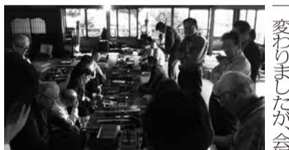
全国美術刀剣会秋期大会の交換会