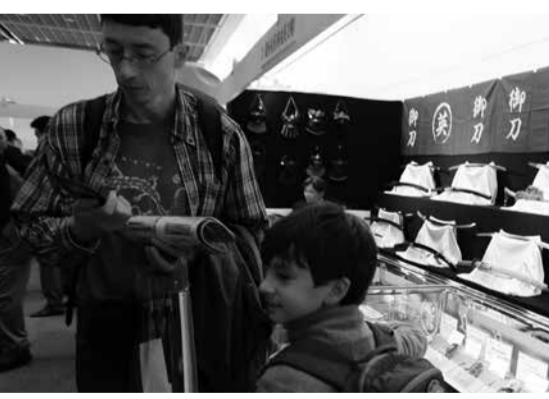
父子連れで訪れた海外からのお客さま