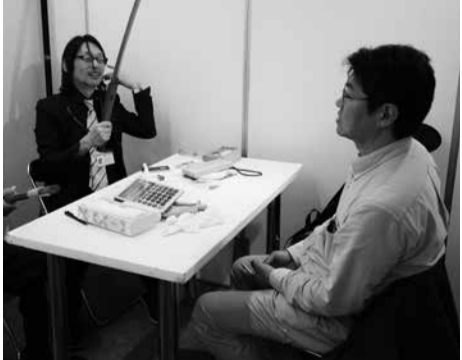
「我が家のお宝鑑定会」でご持参の刀を解説する評価鑑定委員

九州からのお宝鑑定のために 飛行機でわざわざ来られた方が二 組いました。敬意を表したいと思います。 (赤荻稔)