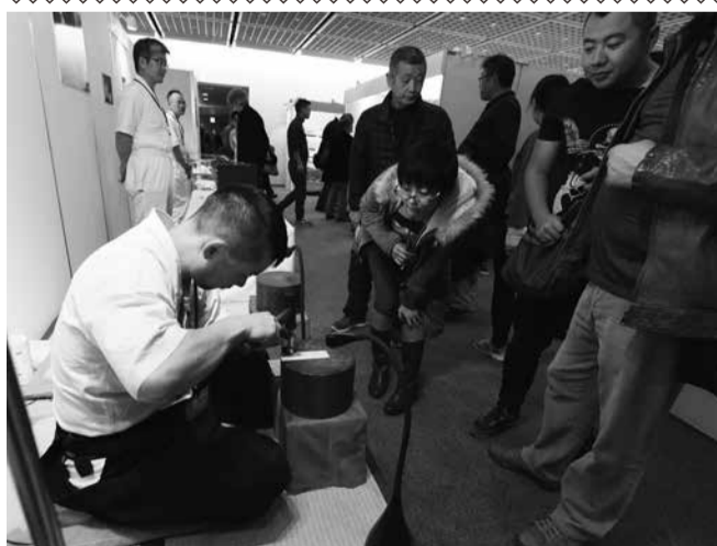
全日本刀匠会関東地方支部の面々による銘切り実演