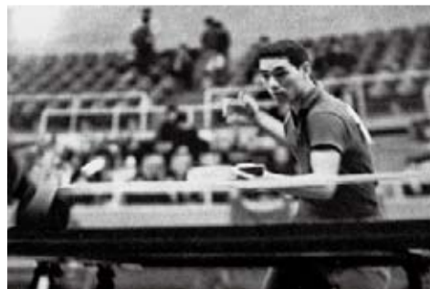
大学時代の筆者の勇姿

日本刀の世界にも深い関心を寄せられ、『狂い咲き正宗』『黄金の太刀』『おれは清麿』『仕事は心をたたく』などの著書がある。ご冥福をお祈りします。