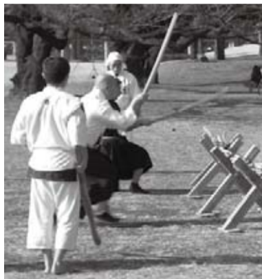
葉丸自顕流頭影会の稽古風景

この航空公園の中心で、家族連れで賑わっているモダンな建物が航空発祥記念館だが、人気アニメ「風立ちぬ」の実在人物で主人公の航空技術者・堀越二郎の資料展示と人の集まりを二分していたのが、エントランスにおける百田尚樹原作のベストセラーを映画化した「永遠のゼロ」のコンセプト展示だった。