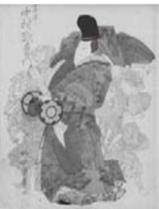
4代目中村歌右衛門の業平(柳斎重春)