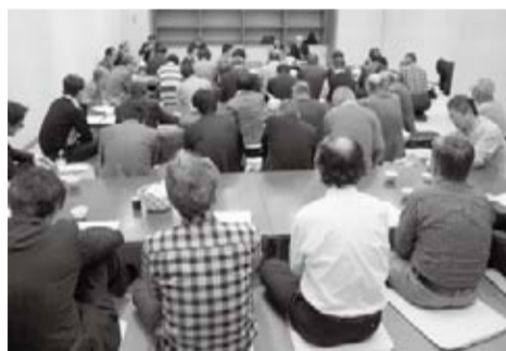
80名を超える関係者が参加した説明会

刀を所持したら、法令に従って必ず所有者変更の届け出をされる度に、私たちは悩まされてきました。例えば、刃渡り一五センチ以上の刀剣類は過去には登録が必要でしたが、最近では五・五センチ以上二五センチ未満であっても登録が必要とされています。また、小刀でも登録が必要なものがあるようで、実際に立件された収集家がいると聞きま