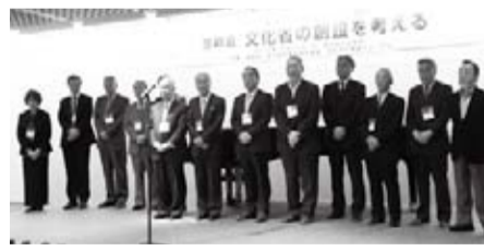
文化芸術推進フォーラムのメンバー