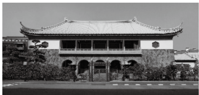
伊東忠太博士の設計による大倉集古館 (登録有形文化財)

喜八郎は、得た富を慈善事業への資金提供や美術品の購入に還元します。美術品購入の背景