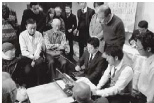
多数が参加した初会

ANAクラウンプラザホテル福岡である。決して狭くない会場は、七十名を超す参加者であふれ、品物の多さで足の踏み場もないほどである。関東や関西の刀剣商も来てはいたが、何と云っても地元九州の業者が多く、氏の人脈の広さをまざまざと感じさせた。魅力的な品も多く集まり、締めみてれば六千万円という出来高をたたき出した。