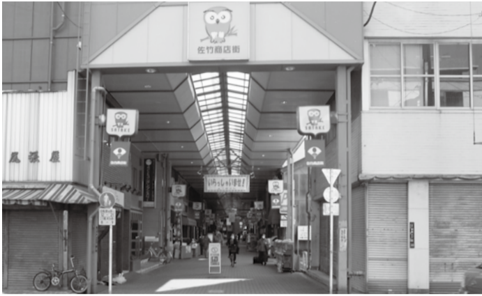
アーケードとカラ―舗装では先駆けの竹町商店街(佐竹商店街)だが…

吉池は現在、増床して建て替えの最中だし、上野松坂屋も建て替えが決まっていると聞いた。竹町商店街のみが残念なことである。 七間町というのが永住町と隣り合っていた。ここには府立第一高等女学校というのがあって、戦後は都立白鷗高等学校になった。名門の女子校だったが、男子校だった日比谷高校などと比べると、今ひとつ有名にならなかった気がする。 私の母は女ばかり六人