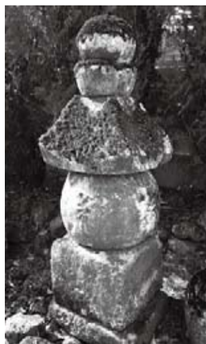
中禅寺石造五輪塔

田昌幸が、千曲段丘の要害の地に上田城を築いたことには、徳川家康の軍勢を二度も撃退し、それにより徳川秀忠が関ヶ原の戦いに間に合わなかったことは、史上有名なことである。子の真田幸村も大坂夏の陣で徳川家康の本陣に迫っており、家康を最も恐れさせた知将として知られる。